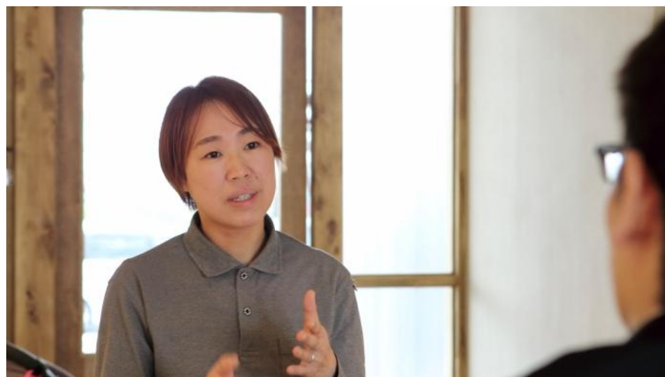
令和7年度取材時の写真

本調査は、電気技術者試験(電気主任技術者及び電気工事士)に合格し、資格取得後にさまざまな分野で活躍している電気技術者に対して、具体的な活動内容や活躍の様子をインタビュー形式で調査し、その結果をホームページを通じて公表しています。